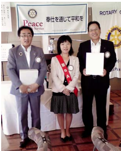
3つのお祝い会員誕生