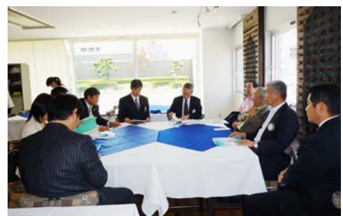
次年度管理運営委員会会議の様子