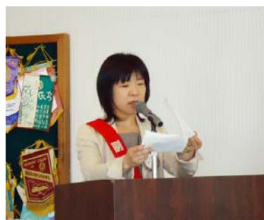
ニコニコボックス伊藤