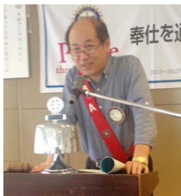
(活動報告) SAA・プログラム委員長 度会会員