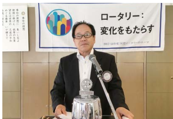
山崎会長就任挨拶