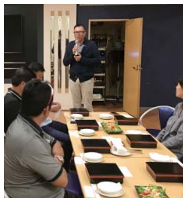
新人歓迎例会：三須会員のスピーチ