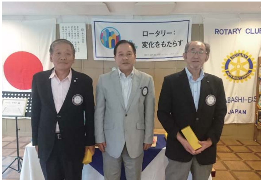
会員誕生日 瀧会員・遠田会員