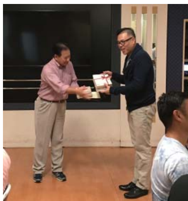
三須会員に記念品贈呈