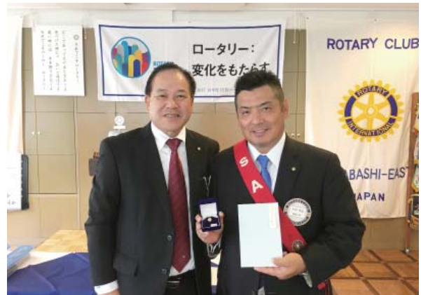
米山功労者 大原会員