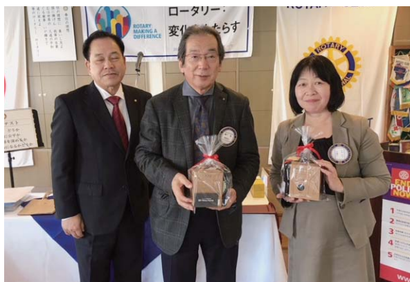
11月夫人誕生 織戸・山本会員