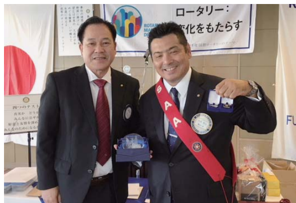
財団メジャードナーの大原会員