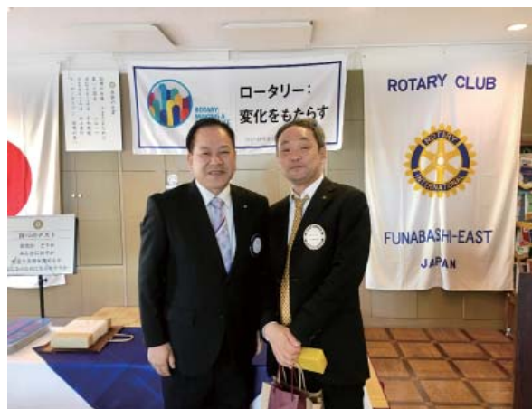
藤代会員三つのお祝い