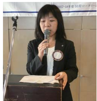
水庫次年度会長挨拶