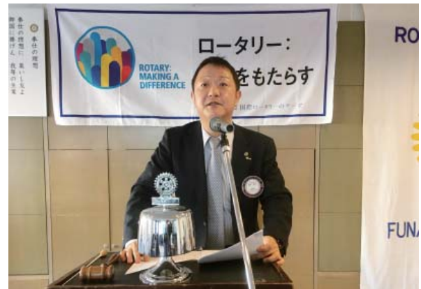
半期会計報告の鈴木会計