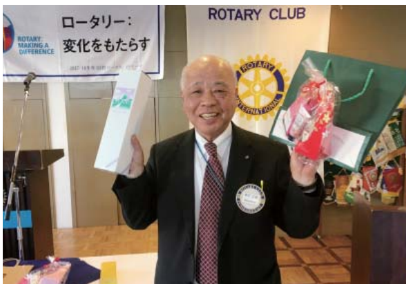
夫人誕生・結婚祝いの柴田会員