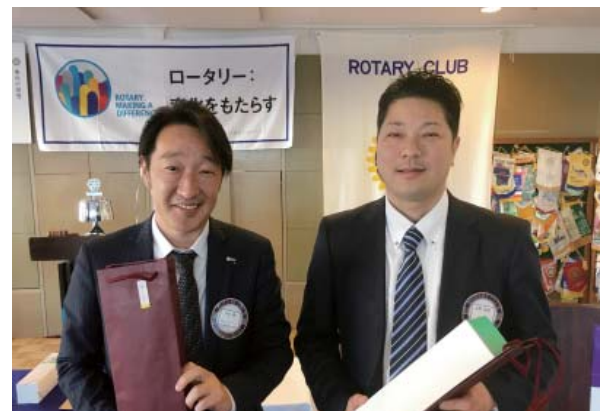
結婚祝い長野会員・平山会員