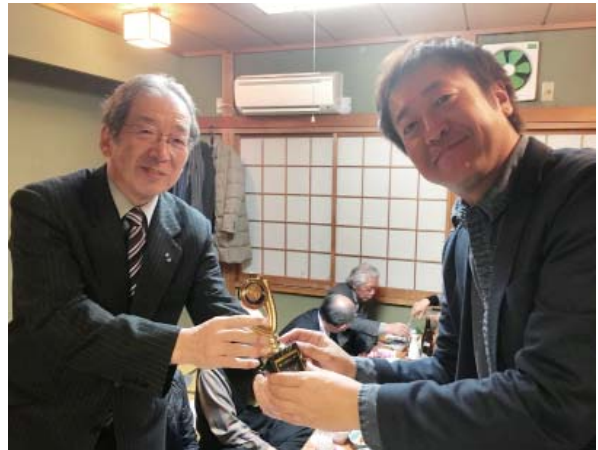
ゴルフ優勝者 鯨井会員