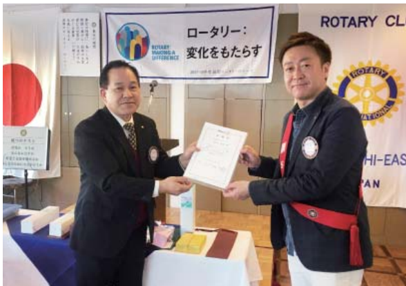
鯨井会員に地区より委嘱状授与