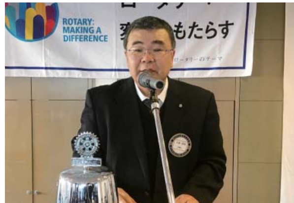
職場見学を呼びかける大家職業奉仕委員長