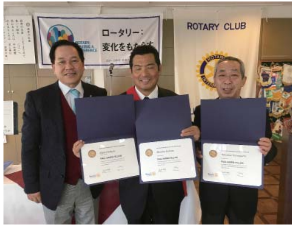
ポールハリスフェロー認証状授与（大原・山口会員ポイントによる）