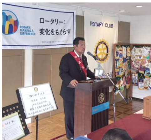
大原会員 みなとRC 式典報告