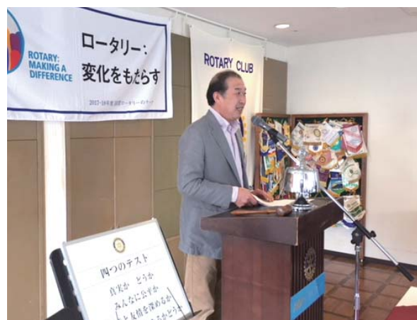
佐々木会員 ミャンマー小学校視察報告