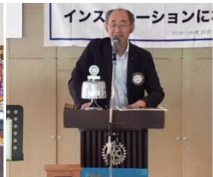
委員会報告 遠田会員