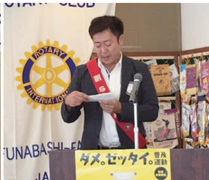
S A A 鯨井会員