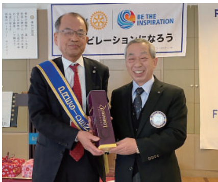
三つのお祝い：山口会員