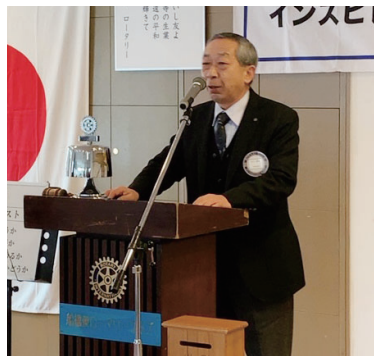
会員卓話：山口会員