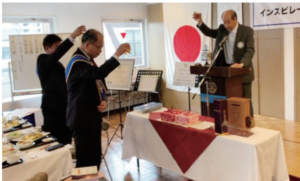
乾杯 度会会長エレクト