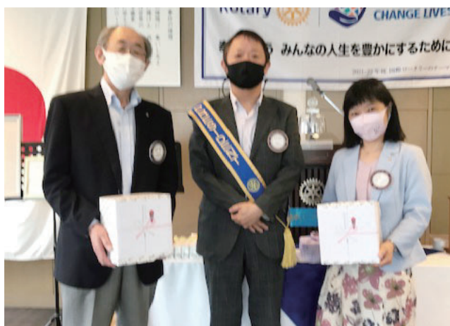
ホームクラブ 100%皆出席者表彰