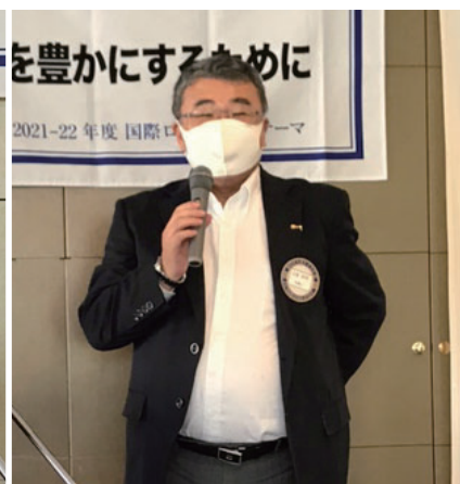
誕生日に因んで 大家会員