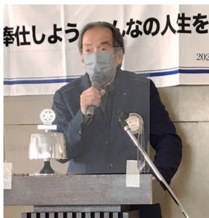
誕生日に因んで 織戸会員