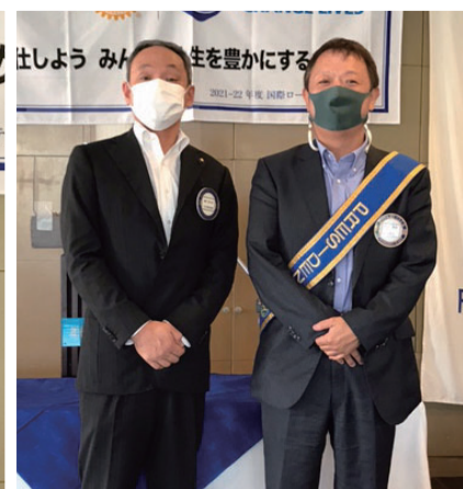
結婚記念日 藤代会員