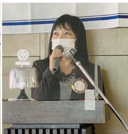
誕生日に因んで 水庫会員