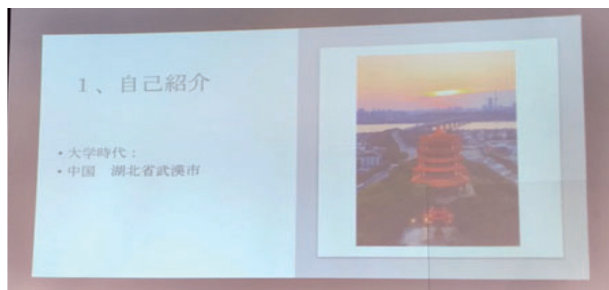
レジュメの データ