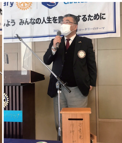
3つのお祝い 大家会員