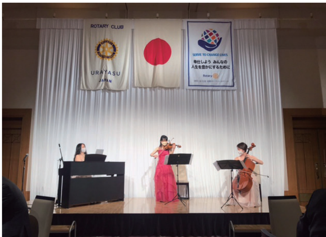
懇親会余興 三重奏