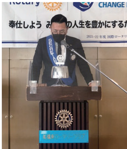
幹事報告 三須幹事