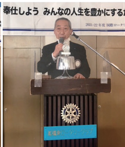
3つのお祝い 山口会員