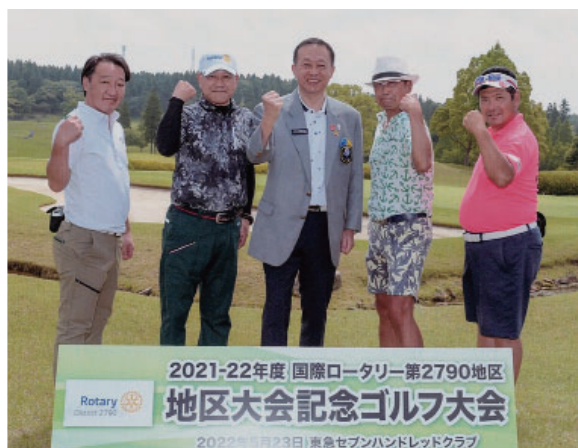
地区ゴルフ大会集合写真