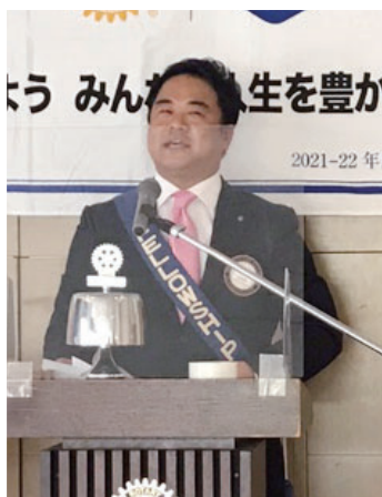
「私の履歴書」行方会員