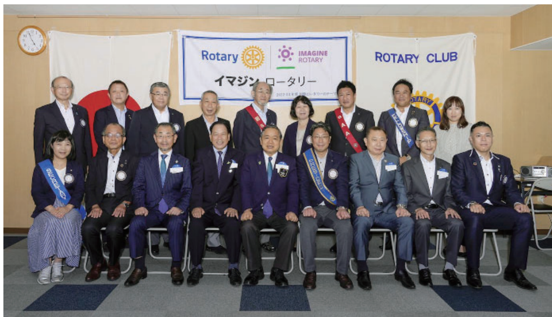
ガバナー公式訪問集合写真