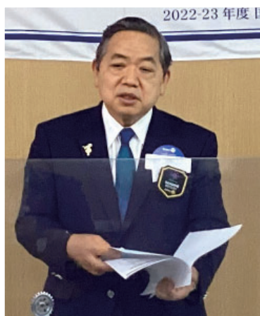
小倉ガバナー 卓話