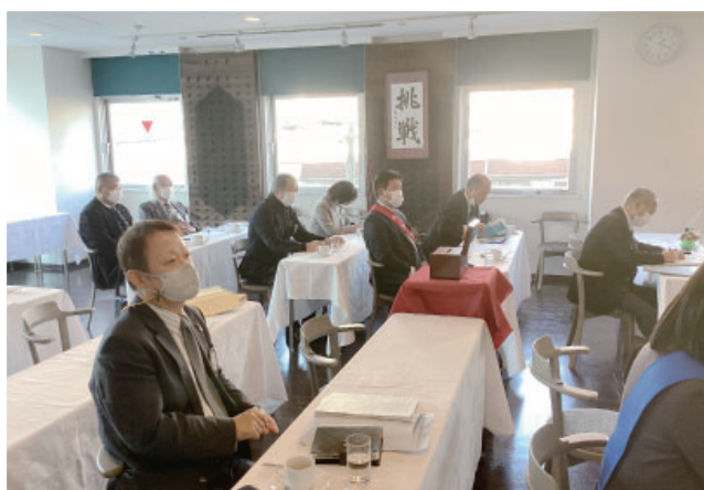
クラブ年次総会風景