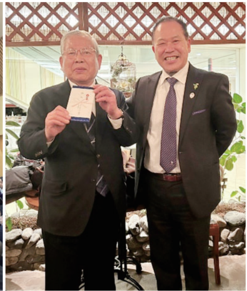
小石前ガバナー補佐へ記念品贈呈