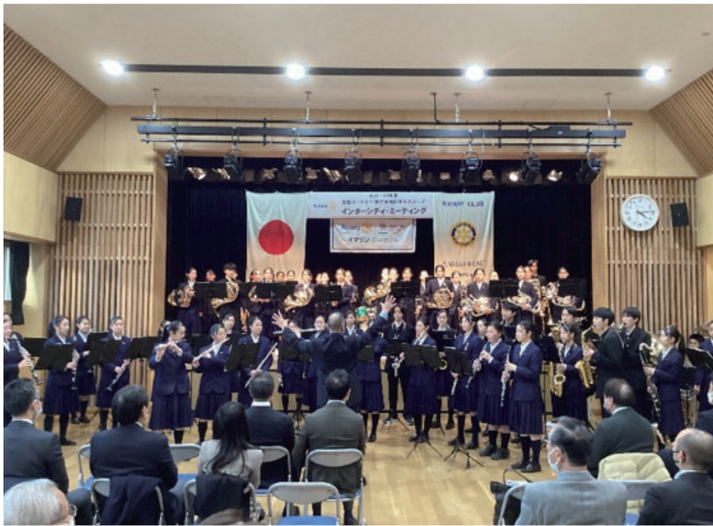
市立船橋吹奏楽部による演奏