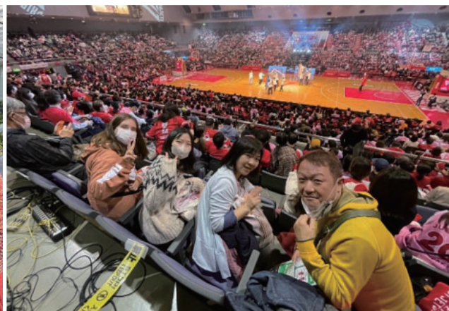
「エリーの休日 イチゴ狩りと千葉ジェッツ観戦」