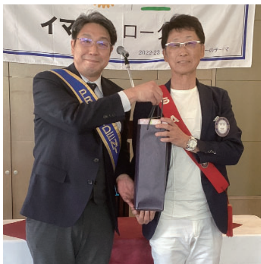
草野会員 3月会員誕生日・卓話「近況報告～ 厄年を迎えて」