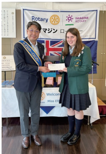
エリー 会長より5月のお小遣い