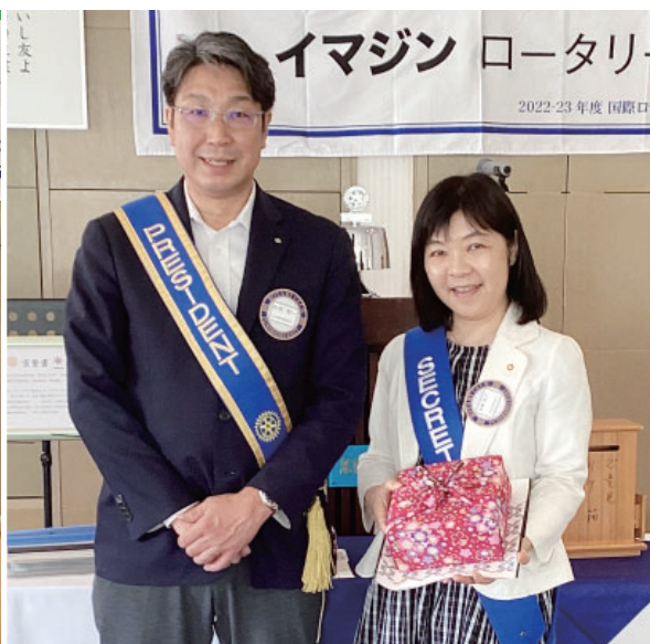
水庫会員 結婚祝い