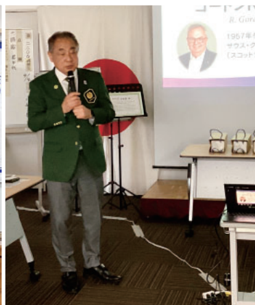
鶴沢ガバナー 卓話