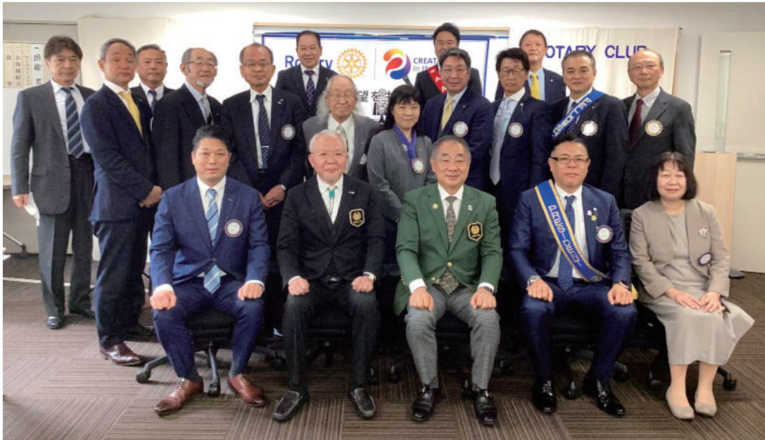
ガバナー公式訪問集合写真